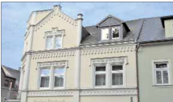
Spuren des 19. Jahrhunderts - Neogotik in Zschopau