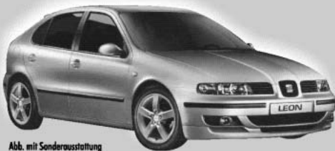
Abb. mit Sonderausstattung

*Kraftstoffverbrauch: kombiniert 6,9 - 7,0 l/100 km *CO 2 -Emission: kombiniert 166 - 168 g/km