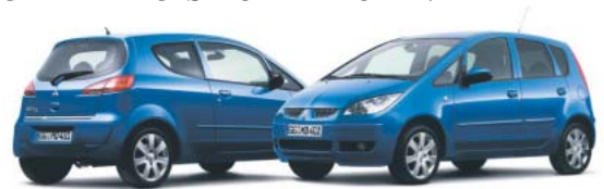
Colt CZ3/Colt „Motion“