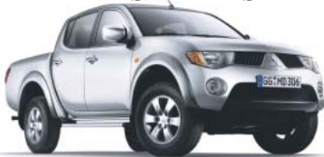
L200 Intense Doppelkabine

STARTEN SIE MIT UNS IN DEN FRÜHLING. ES GIBT EINIGES ZU ENTDECKEN.