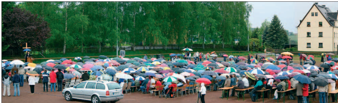
Festgottesdienst anlässlich des 250-jährigen Kirchweihjubiläums in Krumhermersdorf