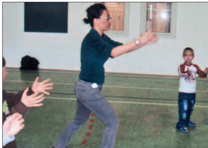
Verteidigungskunst, Entspannungsübungen und ausländische Tänze brachten den Schülern riesigen Spaß!

unter dem deutschlandweiten WM-Motto gestaltete die August-Bebel-Grundschule in Zschopau einen Tag für die Schüler zum kennen lernen der Traditionen und Sprachen fremder Länder. Zu diesem interkulturellen Projekt kamen 10 Studenten aus den Ländern Polen, China, Taiwan, Nigeria, Mocambique und aus Deutschland in die August-Bebel-Schule, um gemeinsam mit den Kindern in die Geheimnisse ihrer Länder einzutauchen.