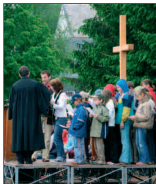
Unter bunten Schirmen hörten ca. 1000 Besucher aus den Nachbarkirchgemeinden die Predigt des Landesbischofs Jochen Bohl auf dem alten Sportplatz.