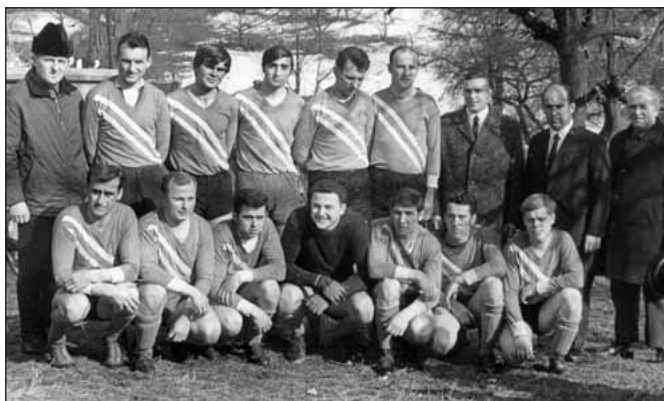
Meister der Bezirksklasse 1968/69

Der erstmalige Aufstieg in die Bezirksliga gelang 1948/49, wenngleich sofort wieder der Abstieg erfolgte. In den darauf folgenden 12 Jahren spielte Krumhermersdorf 1x 1. Kreisklasse, 9x Bezirksklasse und 2x Bezirksliga. In der Folgezeit war eine sehr wechselvolle Klassenzugehörigkeit zu verzeichnen, welche im Jahre 1968/69 zum erneuten Aufstieg in die Bezirksliga führte.