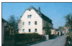
Gut und sicher wohnen