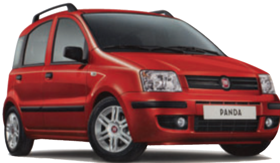
Abb. enthält Sonderausstattung

Der Fiat Panda ab 5.990,- EURO (inkl. FIAT-ecoplus + BONUS) 1 oder ab 49,00 EURO 2 IM MONAT