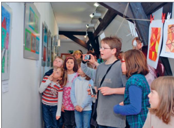
Die jungen Künstler bei der Präsentation ihrer Werke.