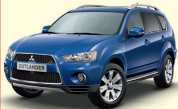
Abb.: Outlander Instyle

MEHR PLATZ. MEHR KOMFORT: MEHR KOMBI FÜR WENIGER GELD. DER NEUE OUTLANDER.