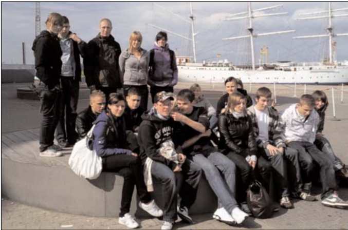
Ein schöner Tag vor dem Oceaneum in Stralsund

Am 22.06.2010 nehmen die Schüler der MS "Martin Andersen Nexö" wieder an der Aktion „genialsozial“ teil. Viele Schüler tauschen an diesem Tag ihre Füller, Kulis u.ä. gegen Hammer, Pinsel, Schaufel und Besen ein. An diesem Tag arbeiten sie für ein soziales Projekt. Ihre Arbeitsstätten sind Vereine, soziale Einrichtungen und Betriebe in und um Zschopau. Wer das erarbeitete Geld erhält, werden wir zu Beginn des neuen Schuljahres bekannt geben.