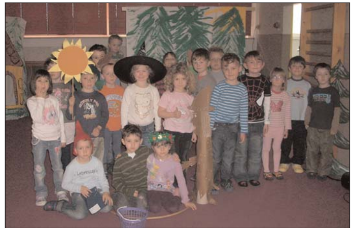
Die Kinder der Gruppe 1 und ihre Erzieherin

Die Spenden werden hoffentlich den vielen betroffenen Menschen, vielen Vätern, Müttern, Töchtern und Söhnen, Zuversicht, Kraft und Hoffnung für ihre Genesung geben. Nun ja, manchmal können wir auch von Kleinen lernen - da sind Kleine ganz groß!