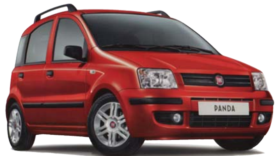
Abb. enthält Sonderausstattung