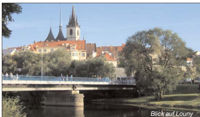
Blick auf Louny

Im Rahmen der Partnerschaftspflege haben wir auch in diesem Jahr geplant, am Sonnabend, dem 14.08.2010, nach Louny zum Sommerfest zu fahren. Es fährt wie gewohnt ein Bus gegen 11:00 Uhr nach Louny, der dann ca. 20:00 Uhr wieder auf die Heimreise geht. Nach einem Mittagessen steht der Nachmittag zur freien Verfügung. Wer Interesse hat, an dieser Fahrt teilzunehmen, meldet sich bitte telefonisch unter 03725 287120 oder per Mail stadtmarketing@zschopau.de an. Die genauen Abfahrtszeiten werden Ihnen zu gegebener Zeit noch mitgeteilt. Es wird ein Unkostenbeitrag in Höhe von 11 EUR/Person erhoben.