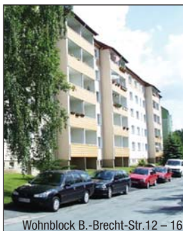
Wohnblock B.-Brecht-Str.12 - 16