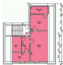
Geräumige 2-Raum- DG-Wohnung Grieß- bach, Grießbacher Hauptstraße 65