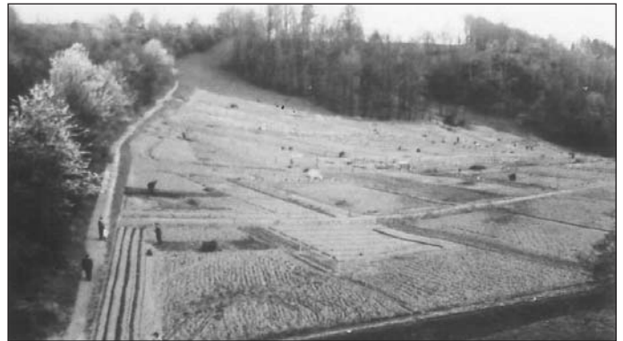
Aufteilung der Parzellen

gebaut. Obwohl je Jahr nur 7 freiwillige Arbeitsstunden von jedem Mitglied gefordert werden, gibt es nicht wenige Mitglieder, die mit mehr als 100, ja sogar mit 250 Arbeitsstunden zu Buche stehen. Ihnen allen gebührt Dank und Anerkennung für die Schaffung dieser schönen blühenden Anlage, an der nicht nur die Kleingärtner sondern auch viele Besucher ihre Freude haben. Bei Ihrem Spaziergang können Sie sich auch von den enormen individuellen Anstrengungen überzeugen, die in den einzelnen Parzellen die Blütenpracht hervorgebracht haben. Sollten Sie nach einem durch das bergige Gelände angestregten Spaziergang Erholung benötigen, so lädt auch die Pächterin der vereinseigenen Gaststätte "Gräbelbaude" zu Speise und Trank ein, wo sicher auch ein Plauderstündchen mit unseren Kleingärtnern dabei ist. Sollten Sie aber bei Ihrem Rundgang selbst Lust auf einen Garten bekommen haben, dann melden Sie sich beim Vorstand, der Ihnen sicher weiterhilft.