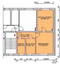
2-Raum-Wohnung Scharfenstein, Obere Siedlungsstraße 111