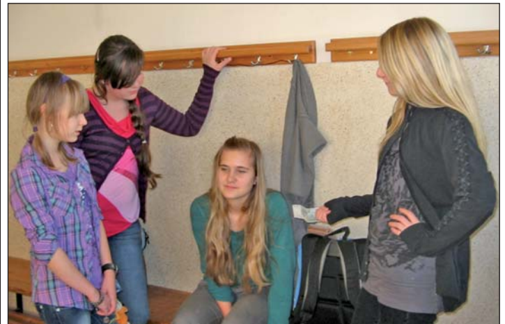
Zahltag in der Umkleide (aus dem Stück)