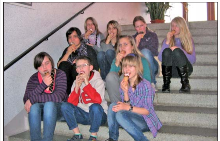
ein verdientes Eis nach den Videoaufnahmen