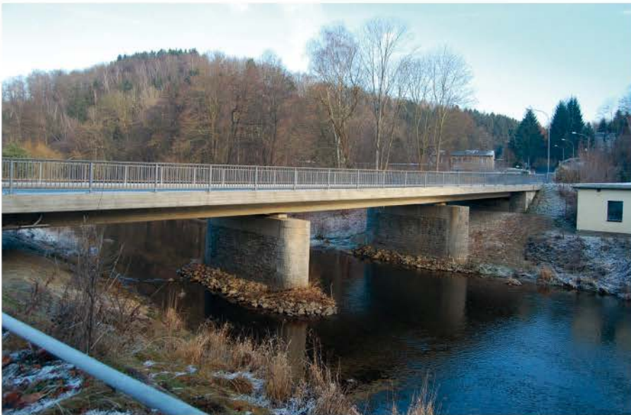
Brücke am Steghaus 2016