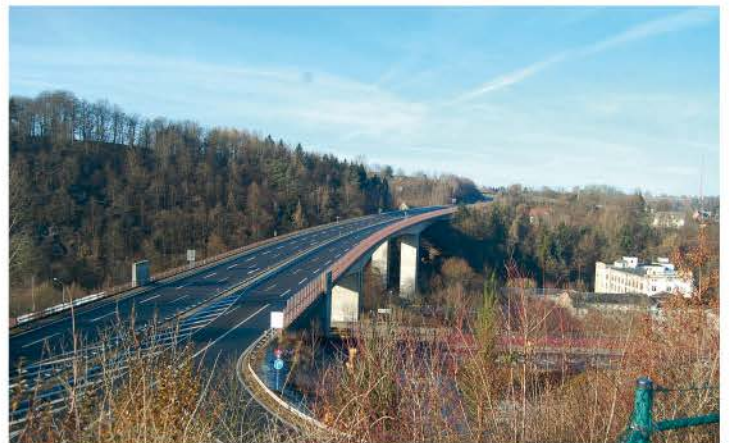
Talbrücke von oben