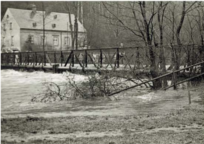
Brücke am Steghaus Hochwasser Januar 1932