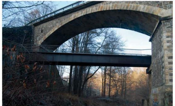
Fußgängerbrücke am Schlachthof flussaufwärts