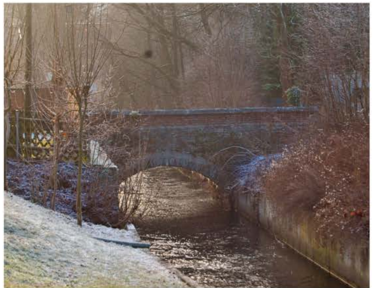
Mühlgraben am Zweigwerk 2