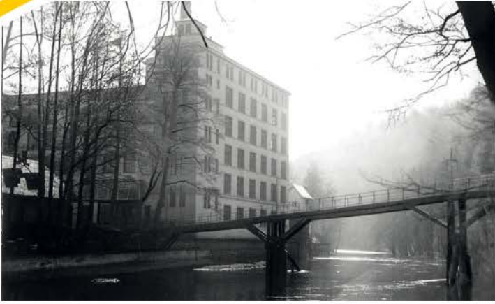
Fußgängerbrücke an der Spinnerei 1930