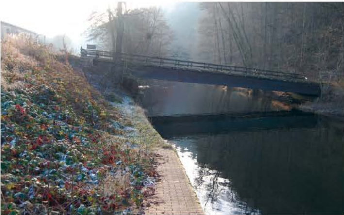
Fußgängerbrücke an der Spinnerei flussaufwärts 2016