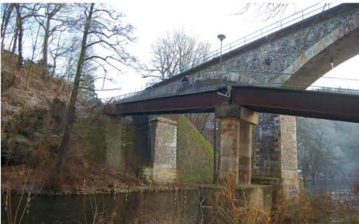
Fußgängerbrücke am Schlachthof flussabwärts