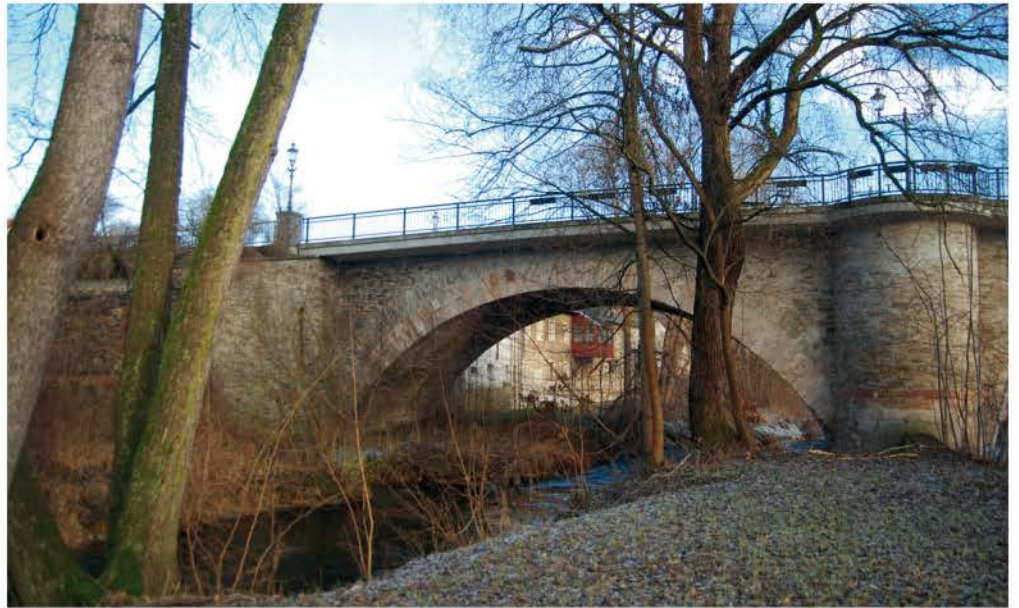
Zschopau Brücke flussabwärts 2016