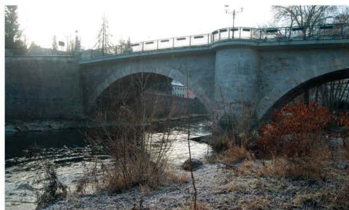
Zschopau Brücke flussaufwärts 2016