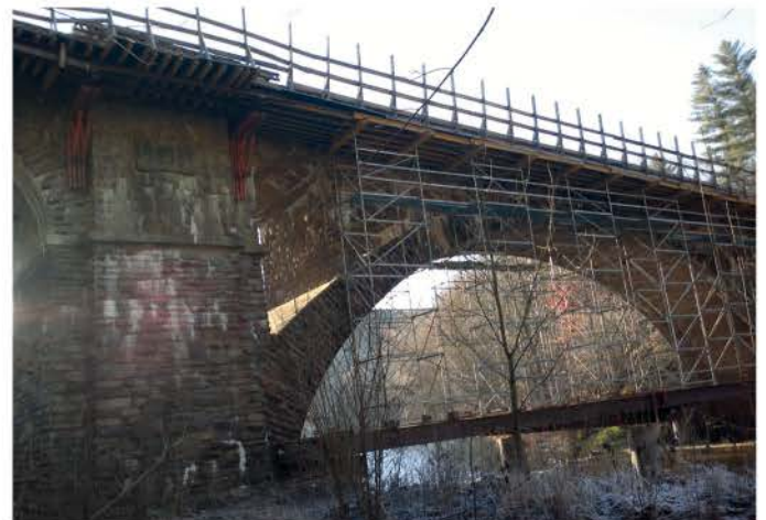
Wilischthal Brücke flussaufwärts rechts 2017