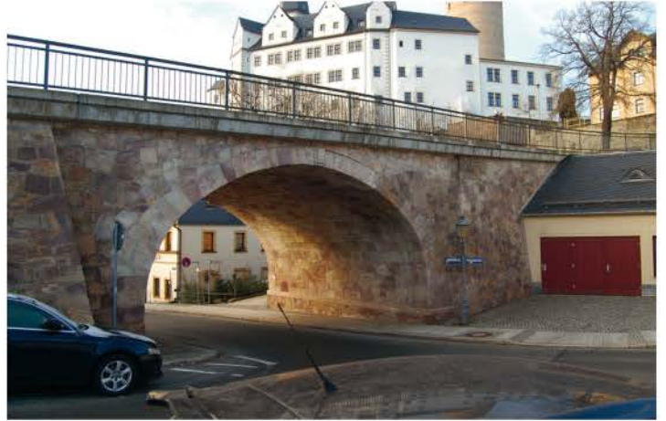
Bismarckbrücke Blick zur Gartenstraße 2016