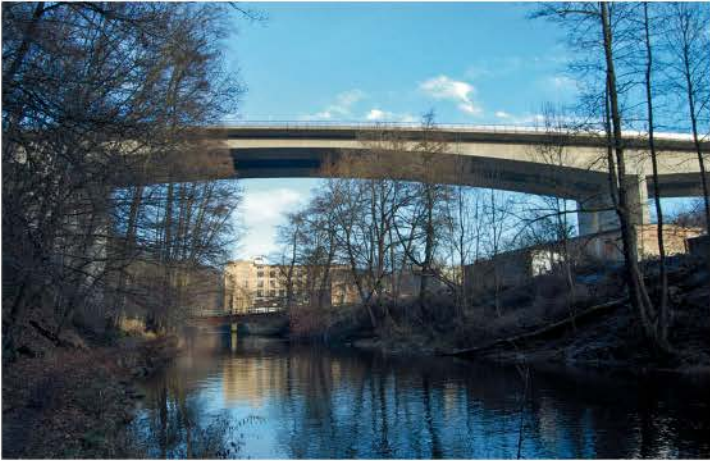
Talbrücke von unten