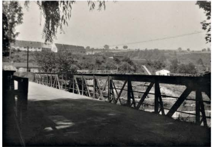
Brücke am Steghaus 1958