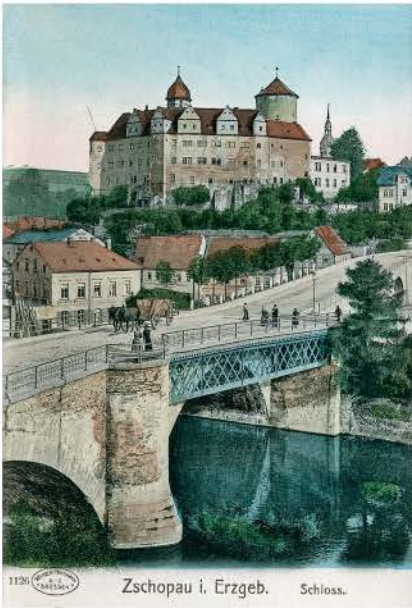
Zschopau Brücke flussaufwärts handkolorierte Postkarte 1907