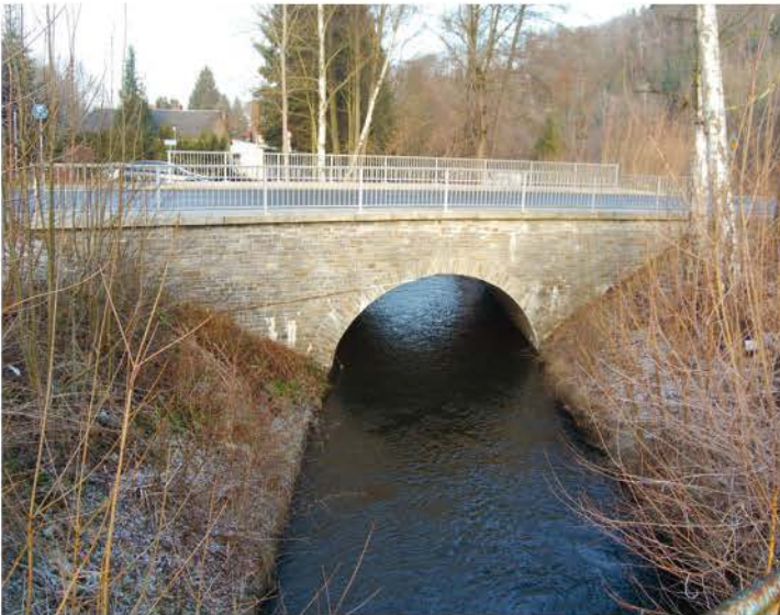
Mühlgraben am Zweigwerk 1