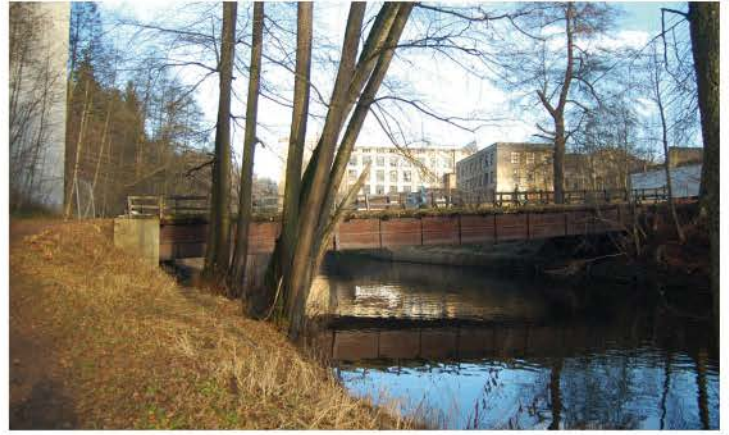
Fußgängerbrücke an der Spinnerei flussabwärts 2016