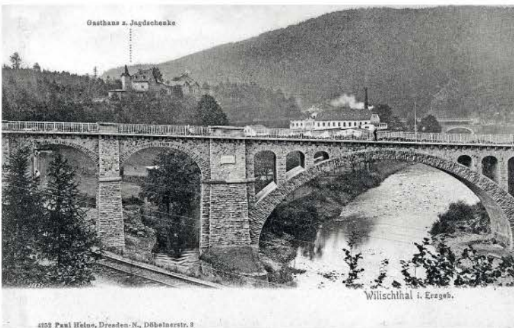
Wilischthal Brücke flussaufwärts 1906