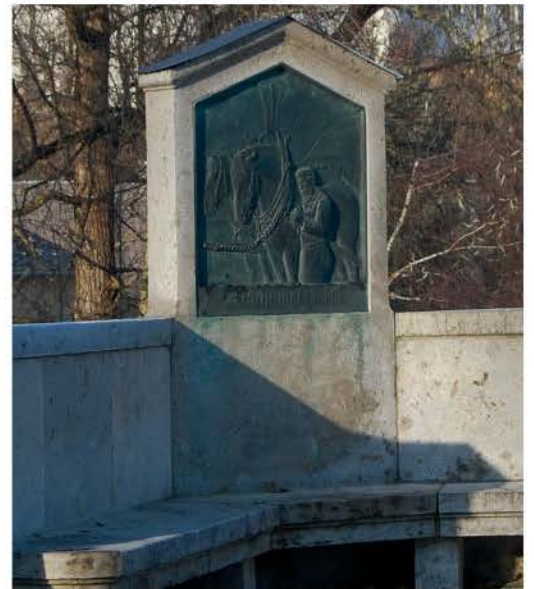
Zschopau Brückendenkmal von 1932