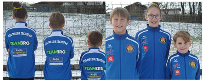
Der Nachwuchs freut sich über neue Jogginganzüge.

Dennoch geht bei uns im Verein die Vereinsarbeit weiter. Das sind wir schließlich unseren Vereinsmitgliedern und dabei speziell den mittlerweile fast 70 Nachwuchskickern schuldig. Aus diesem Grund freuen wir uns ganz besonders, dass wir unsere Nachwuchsabteilung mit einem vorfristigen Weihnachtsgeschenk überraschen konnten. Mit Hilfe einiger Sponsoren gelang es, insgesamt 49 Jogginganzüge anzuschaffen. Wir bedanken